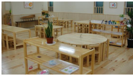
2～5 歳児クラスの保育室