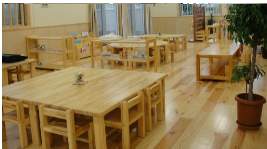
0・1 歳児クラスの保育室

一人ひとりの活動から集団の活動へ移行する中で、自ら意欲的に様々な活動に取り組んでいき、健やかに心とからだを育みます。